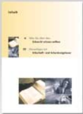
DIN-A5 Broschüre 32 Seiten