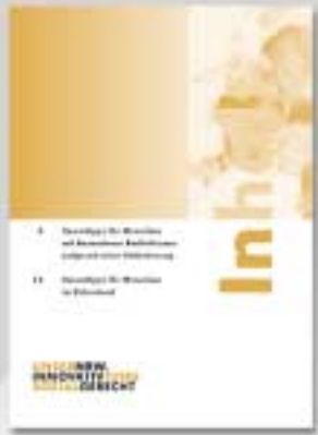
DIN-A5 Broschüre 32 Seiten