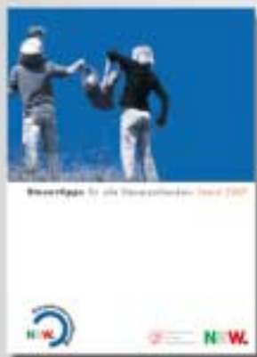
DIN-A5 Broschüre 56 Seiten