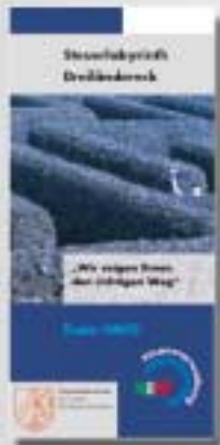
Flyer 4 Seiten