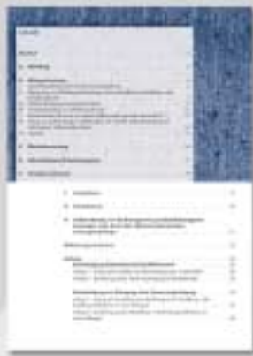
DIN-A4 Broschüre 44 Seiten