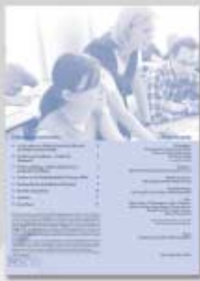
DIN-A4 Broschüre 12 Seiten