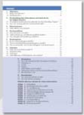
DIN-A4 Broschüre 56 Seiten